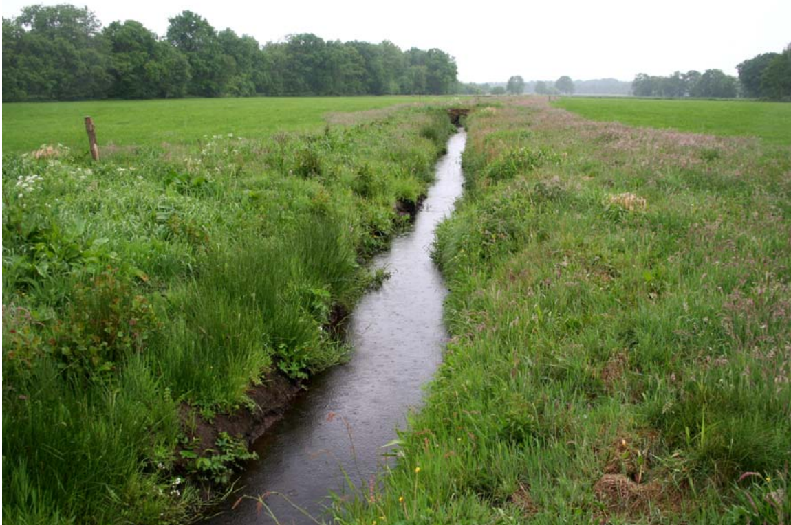
Walle zwischen Vorwerk und Dipshorn mit Uferabflachungen und Gewässerrandstreifen (Mai 2007)