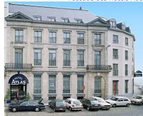
Eingang – Empfang