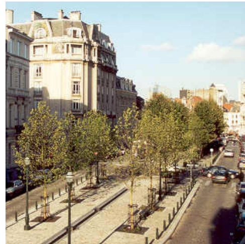
Fassade des Hotels Atlas