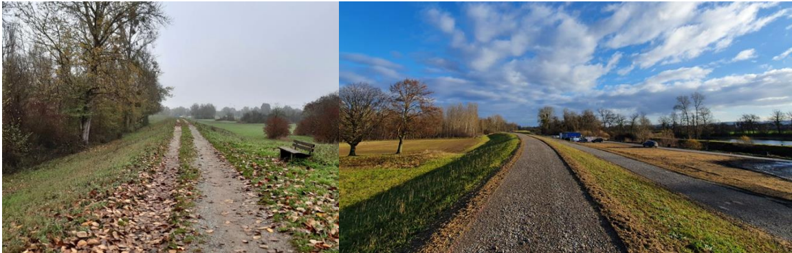
Abbildung 1 - Beispiele für Deichabschnitte vor und nach der Sanierung (links: Rheinhochwasserdamm XXV bei Elchesheim-Illingen, rechts: Rheinwasserdamm XXV bei Au am Rhein), Bildrechte: CDM Smith

Die Arbeit der Kleingruppe stellt die unterschiedlichen Herangehensweisen und die Erfahrungen bei der Sanierung von Flussdeichen im Ergebnis des Austauschs dar. Die Kernpunkte wurden in dem vorliegenden Positionspapier zusammengefasst und gemeinsame Handlungsgrundsätze definiert. Vertretungen des Bundes und der Länder BY, BB, HE, MV, NI, NW, RP, SN, ST und TH trafen sich dazu in 2021 und 2022 in 4 Arbeitssitzungen (3 Videokonferenzen und einem Präsenztreffen) sowie zu zwei vertiefenden Erfahrungsaustauschen im Onlineformat.