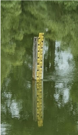
Abbildung 6 - Hochwasser (Rheinhochwasserdamm 2021)

Gemeinsam mit den Naturschutzverwaltungen sind vor diesem Hintergrund klimawandelangepasste Lösungen für Planung, Bau und Unterhaltung von Deichanlagen zu finden. Das NHWSP legt bewusst Wert auf die Nutzung von Synergien mit der Gewässer- und Auenentwicklung, der Anpassung an den Klimawandel und den Naturschutz. In einem Forschungs- und Entwicklungsvorhaben des Bundesamtes für Naturschutz (BfN) wird eine praxisnahe Methode zur Ermittlung und Bewertung sowie zur Berücksichtigung von Synergien bei der Umsetzung des NHWSP entwickelt.