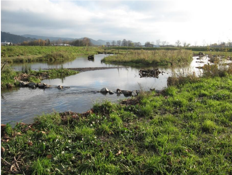
Abbildung 5 - Beispiele für eine Deichrückverlegung (Winkelbach Bensheim)

In der Diskussion der Grundsätze zeigten sich keine maßgebenden Unterschiede bei den Bundesländern.