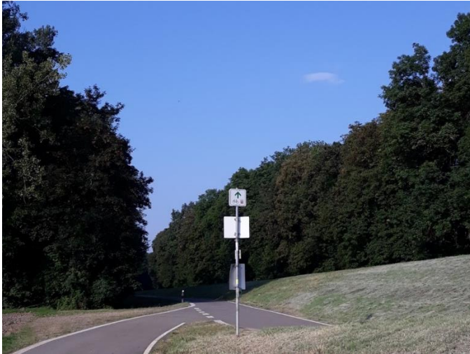
Abbildung 2 - Beispiel für Mehrfachnutzung (Weschnitzdeich Biblis nach der Sanierung)

Da die Zuständigkeiten je nach Wassergesetz oder einer Deichschutzverordnung in den Bundesländern unterschiedlich geregelt sind, zeigen sich hier auch Unterschiede im Umgang und der Zuständigkeit. So gilt es z. B. zu unterscheiden zwischen Unterhaltspflichtigen und der Deichaufsicht. In einigen Bundesländern ist dies in einer Hand, in anderen getrennt.