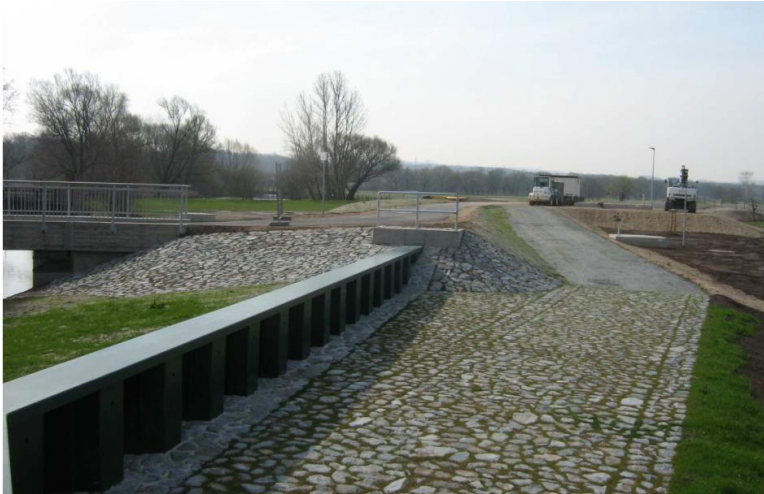
Abbildung 3 - Beispiel für eine Überlaufstrecke

Offene Fragen bestehen vor allem beim rechtlichen und verfahrenstechnischen Umgang mit der potentiell betroffenen „Überlastungsfläche“. Für eine erfolgreiche Realisierung der Entlastungsstellen ist eine entsprechende Flächenverfügbarkeit mit möglichst hochwasserunsensibler Nutzung ideal. Bei Siedlungsflächen hingegen bestehen große Vorbehalte. Eine offene Kommunikation und eine begleitende, gute Öffentlichkeitsarbeit sind für die Akzeptanz der Maßnahmen zwingend notwendig.