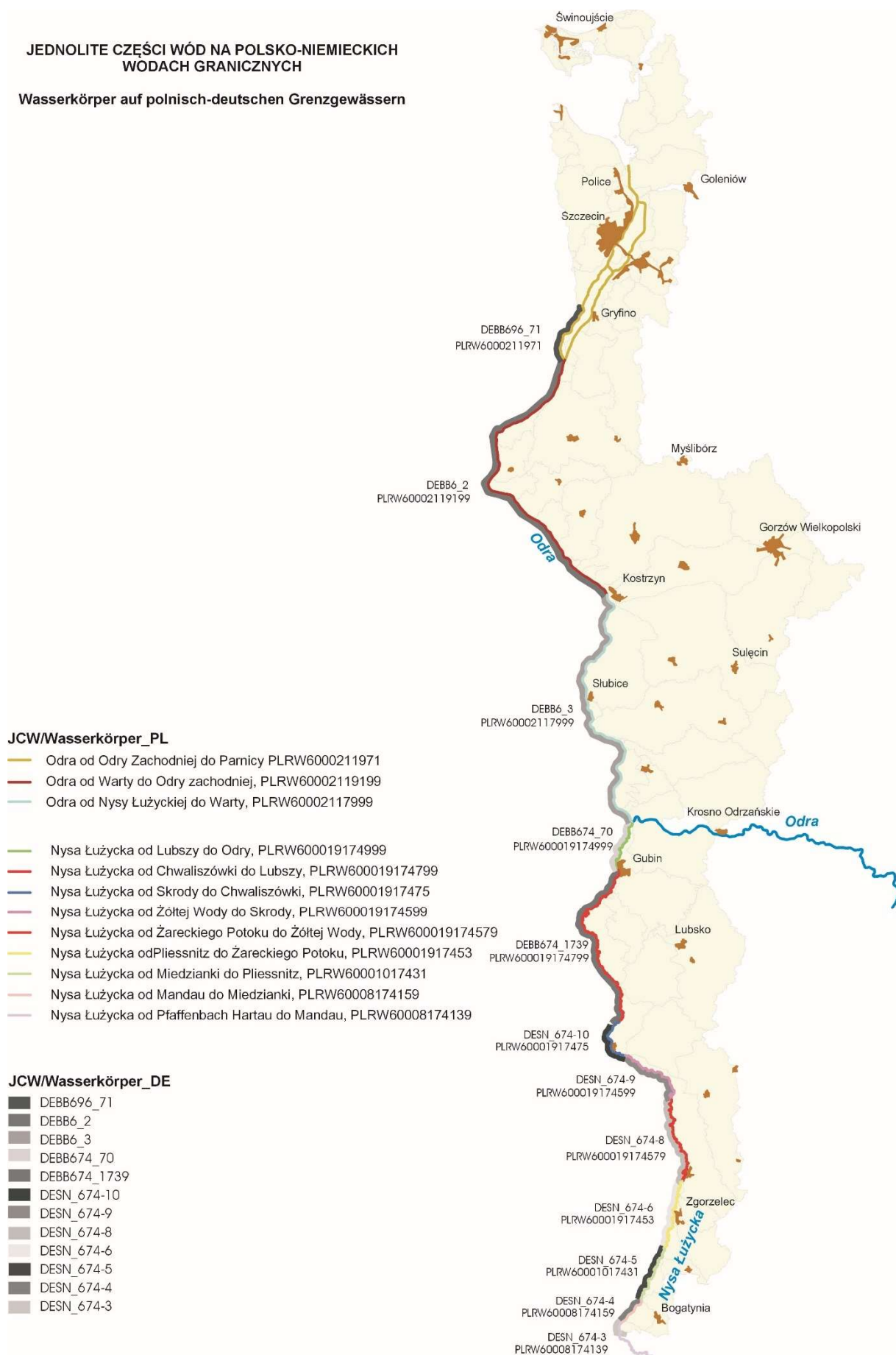
Rys. 2.1-1 Jednolite części wód na polsko-niemieckich wodach granicznych

Wasserkörper auf polnisch-deutschen Grenzgewässern