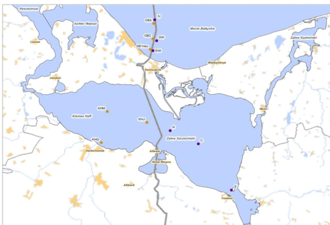
Mapa 3.2-1. Lokalizacja stanowisk pomiarowych na Zalewie Szczecińskim i Zatoce Pomorskiej