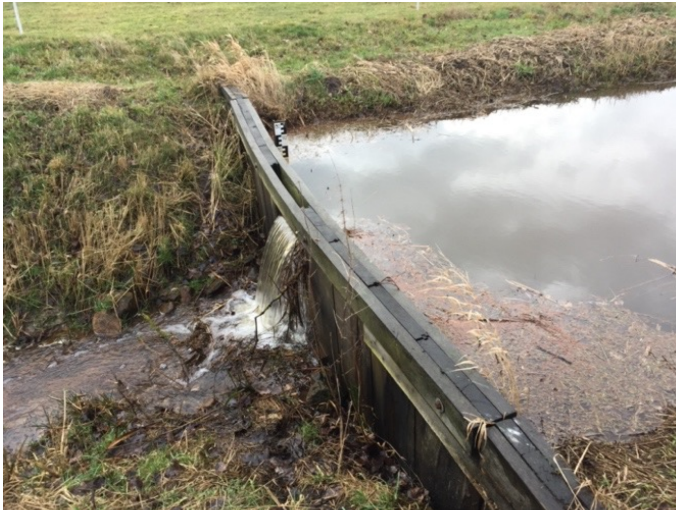
Aufnahme am 23. März 2020