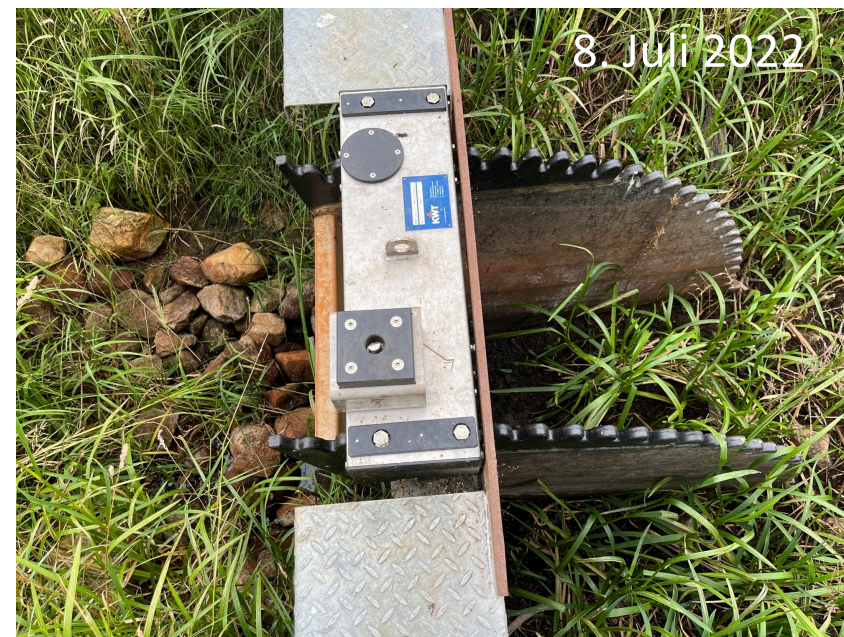
8. Juli 2022