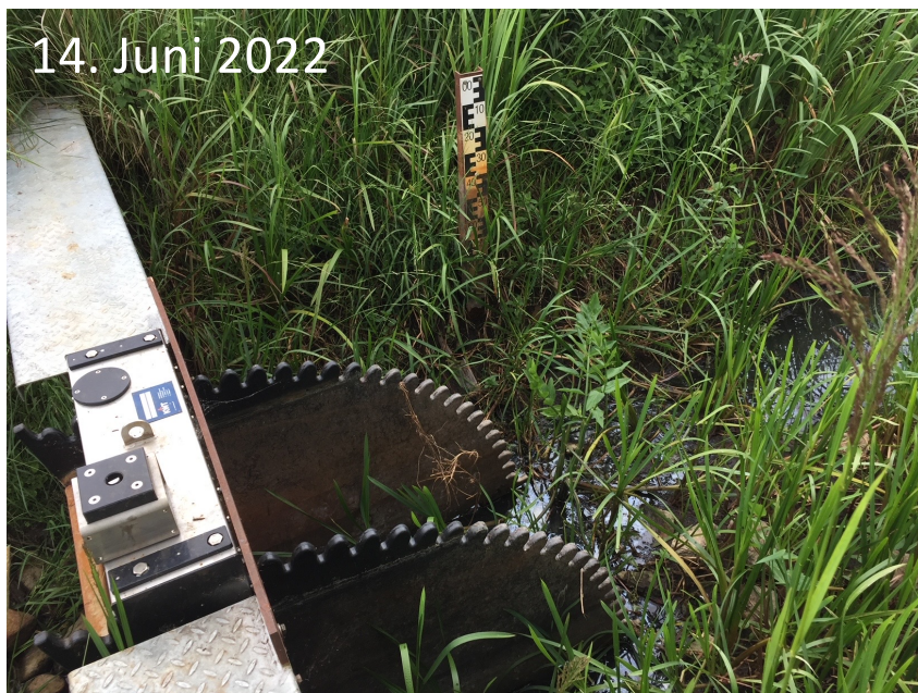
14. Juni 2022