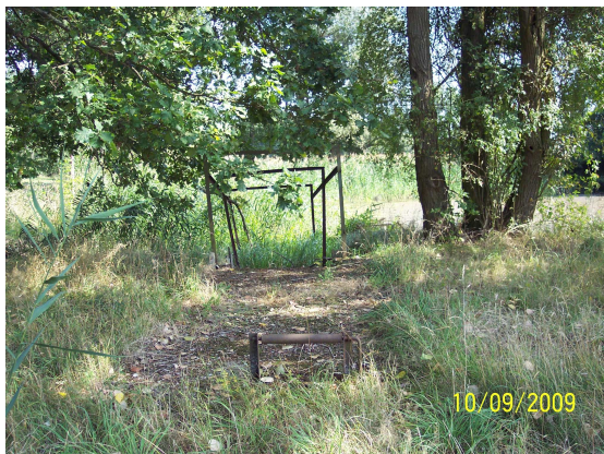
Abbruch Beton / Schrott am Ufer