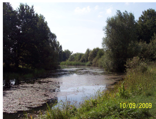
Altarm 13 (Blick flussaufwärts vom Ablauf)

Der relativ breite Altarm weist nur sehr lückenhaften Baum- und Strauchbewuchs auf. Streckenweise sind linkes und rechtes Ufer frei von Bewuchs. Am Zulauf zur Spree befindet sich linksseitig eine größere Baumgruppe („Wäldchen“). Der Bereich des verfüllten Zulaufs ist nur durch mäßigen Baumbewuchs gekennzeichnet.