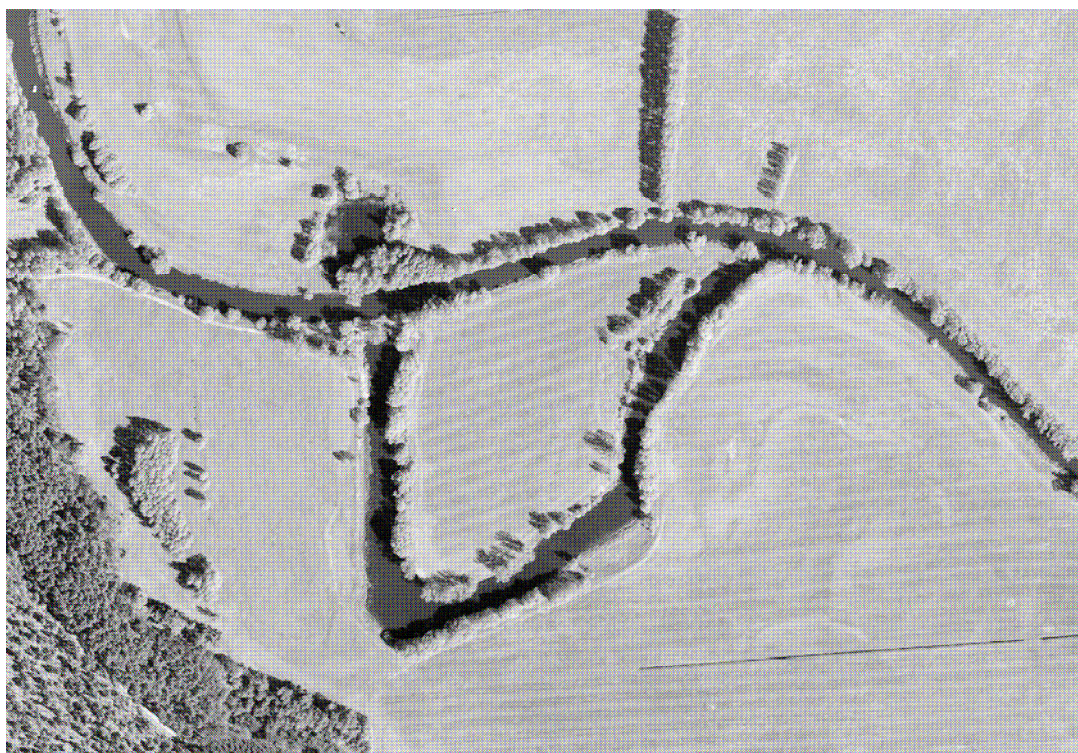
Luftbild Altarm 13 von Spree- km 141,96 – 142,34

Der in der Stauhaltung „Trebatsch“ gelegene Altarme 13 befindet sich rechtsseitig der Krumpfen Spree von Fluss- km 141,96 – 142,34 in den Gemarkung Kossenblatt (Gemeinde Tauche / Landkreis Oder-Spree). Der Gewässerabschnitt verläuft südlich der OL Kossenblatt.