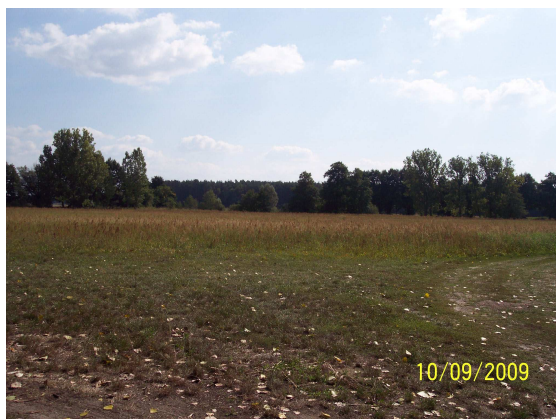
Altarm 13 (Grünlandnutzung)