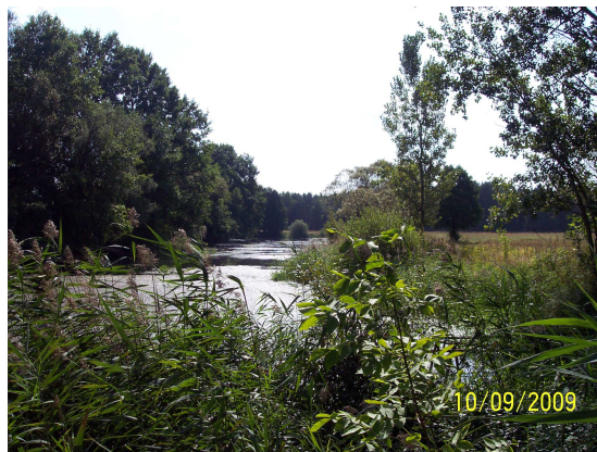
Altarm 13 (Altarmzulauf Blick flussabwärts)