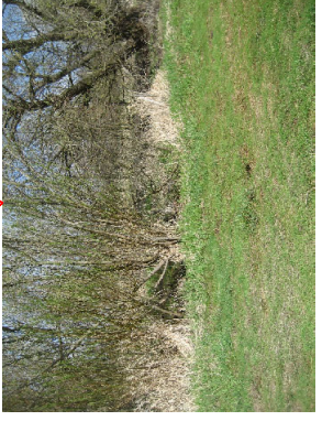
Erlen und Rotdorn