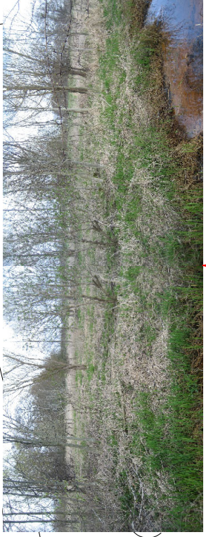
Erlen und Holunder