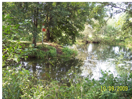
Altarm 17 (Blick auf den Ablauf)

Der relativ schmale Altarm weist am inneren Ufer keinen bzw. sehr geringen Baumbestand auf. Zu- und Ablauf zur Krummen Spree sind hingegen durch dichten Baumbestand gekennzeichnet.