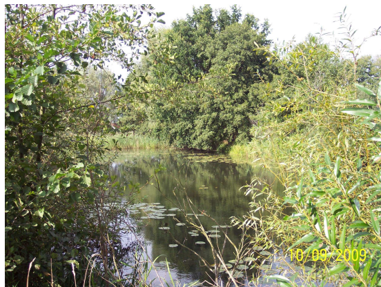
Altarm 17 (Altarmzulauf Blick flussaufwärts)