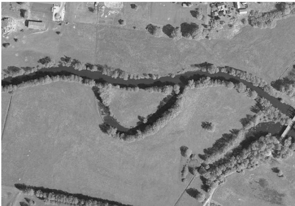
Luftbild Altarm 17 von Spree- km 138,39 – 138,56

Der in der Stauhaltung „Trebatsch“ gelegene Altarm 17 befindet sich rechtsseitig der Krumpfen Spree von Fluss- km 138,39 – 138,56 in den Gemarkung Briescht (Gemeinde Tauche / Landkreis Oder-Spree). Der Gewässerabschnitt verläuft im unmittelbaren Randbereich der Ortslage Briescht.