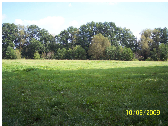
Altarm 17 (Grünlandnutzung)