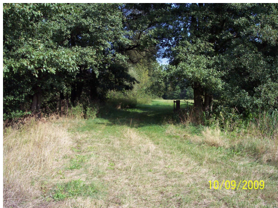
Altarm 17 (Überfahrt / verfüllter Altarmzulauf)

Der Altarm 17 weist eine Gesamtlänge von rund 270 m sowie eine Wasserspiegelbreite von etwa 18-20 m auf. Der Zulauf zum Altarm wurde verfüllt. Hier befindet sich die Altarmüberfahrt zur als Grünland genutzten Inselfläche. In der Überfahrt verläuft ein Rohrdurchlass aus Stahl DN 600.